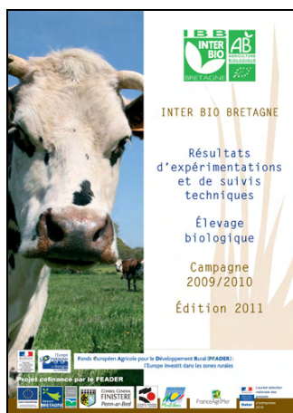
Résultats d'expérimentations et de suivis techniques "Élevage biologique" en Bretagne. Campagne 2009-2010 / Édition 2011

Les brochures techniques de restitution des expérimentations menées en 2010 (édition 2011) sont désormais disponibles à Inter Bio Bretagne ou téléchargeables, action par action, depuis www.interbiobretagne.asso.fr .