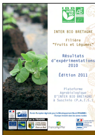
P.A.I.S. - Plate-forme Agrobiologique d'Inter Bio Bretagne à Suscinio. Filière "Fruits et Légumes" Bio. Résultats d'expérimentation 2010 - Édition 2011

Transmission des visuels des couvertures des brochures techniques en format JPG sur demande